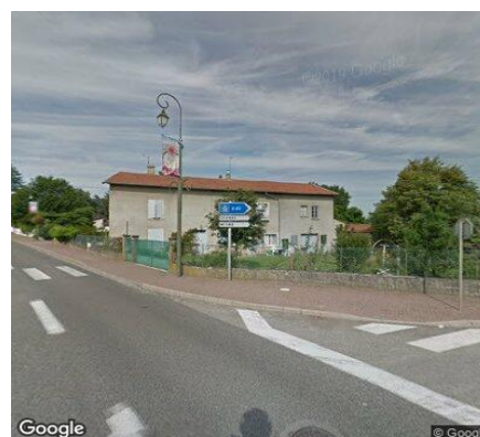
Vue STREET VIEW du secteur